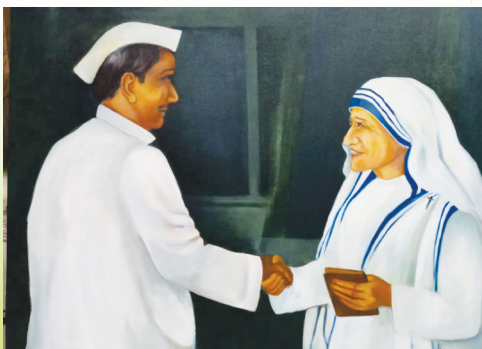
मदर टेरेसा का स्वागत करते हुए