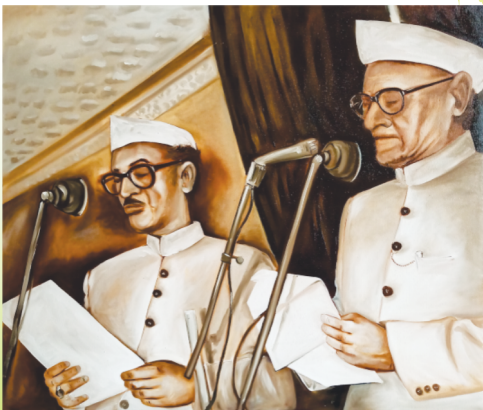
उ.प्र. के मुख्यमंत्री के रूप में शपथ ग्रहण करते हुए (1974)