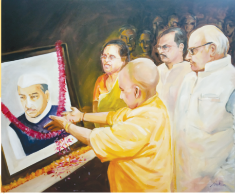
बहुगुणा जी के चित्र पर माल्यार्पण करते हुए मा. मुख्यमंत्री योगी आदित्यनाथ जी, मा. विधानसभा अध्यक्ष एच.एन. दीक्षित जी एवं अन्य