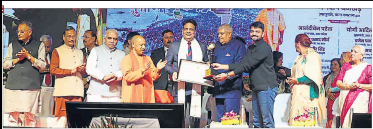
अध्य शिल्पग्राम में शुक्रवार को उत्तर प्रदेश दिवस पर विभिन्न क्षेत्रों में विरंजित योगदान के लिए छह विभूतियों को सम्मानित किया गया। इस मौके पर उपराष्ट्रपति जगदीप धनखड़, मुख्यमंत्री योगी आदित्यनाथ, राज्यपाल आनंदीबेन पटेल समेत अन्य मौजूद रहे।