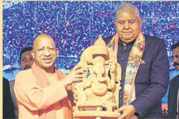
लखनऊ में उपराष्ट्रपति जगदीप धनखड़ को सम्मानित करते मुख्यमंत्री योगी आदित्यनाथ।