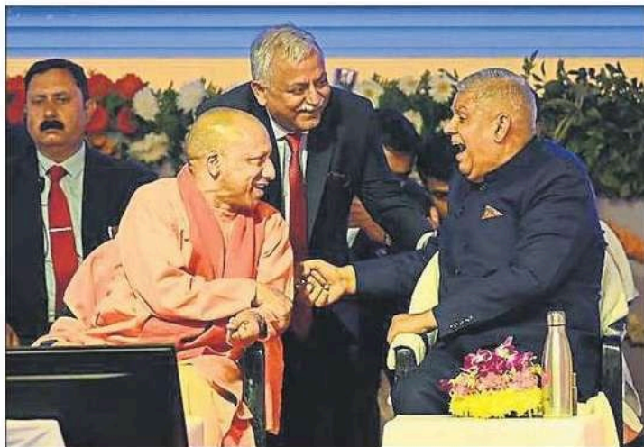
Vice-President Jagdeep Dhankhar with chief minister Yogi Adityanath during the 76th Foundation Day celebrations of Uttar Pradesh, in Lucknow on Friday.