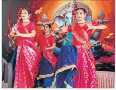
अध्य शिल्पग्राम में उत्तर प्रदेश स्थापना दिवस पर शुक्रवार को सांस्कृतिक कार्यक्रम प्रस्तुत करते कलाकार।