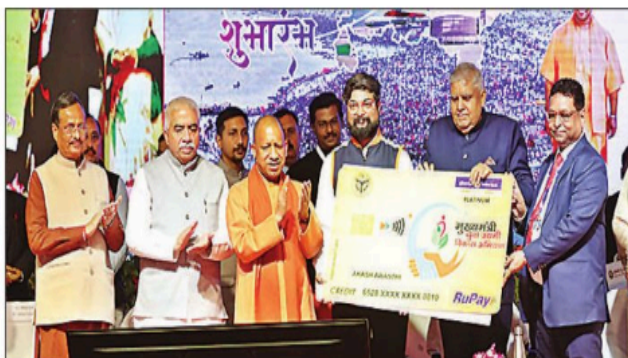
मुख्यमंत्री युवा उद्यमी विकास अभियान के तहत युवाओं को ऋण प्रदान करते उप राष्ट्रपति जगदीप धनखड़, साथ में मुख्यमंत्री योगी

वे शुक्रवार को राज्यपाल आनंदीबेन पटेल और मुख्यमंत्री योगी आदित्यनाथ के साथ राजधानी के अवध शिल्पग्राम में आयोजित उत्तर प्रदेश स्थापना दिवस समारोह का उद्घाटन करने के बाद बोल रहे थे। उप राष्ट्रपति ने महाकुंभ की चर्चा करते हुए कहा कि पूरी दुनिया