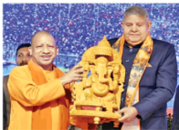
अवध शिल्पशाला में उप दिवस के अवसर पर उपराष्ट्रपति जगदीप धनखड़ का स्वागत करते मुख्यमंत्री योगी आदित्यनाथ

राज्य न्यूरो, जागरण • लखनऊ: उपराष्ट्रपति जगदीप धनखड़ ने दिल्ली विधानसभा चुनाव में चल रहे घुसपैठियों के मुद्दे को इशारों-इशारों में हवा दी। उपराष्ट्रपति ने कहा कि भारत में करोड़ों की संख्या में अवैध प्रवासियों का होना चिंता की बात है। ये स्वास्थ्य, शैक्षणिक सेवाओं को चुनौती देते हैं, नौकरियों के अवसरों को प्रभावित करते हैं। सबसे बड़ी बात यह है कि ये चुनावी प्रक्रिया को भी प्रभावित करना चाहते हैं। पूरी दुनिया इसे लेकर सचेत हो चुकी है। भारत में इस पर ध्यान देने की जरूरत है कि करोड़ों की संख्या में अवैध प्रवासी यहां क्यों हैं? इनको लेकर अखिलंब कदम उठाने चाहिए। उपराष्ट्रपति ने युवाओं से देश के विपरीत काम करने वालों और देशहित की न सोचने वालों पर प्रतिघात करने का भी आह्वान किया। घुसपैठियों पर उपराष्ट्रपति की इस टिप्पणी को दिल्ली चुनाव से जोड़कर देखा जा रहा है।