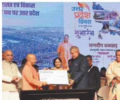
Vice President Jagdeep Dhankhar with Chief Minister Yogi Adityanath during the UP Diwas celebration in Lucknow on Friday

Dhankhar also called for reducing imports and enhancing domestic production. "It is painful to see India importing goods such as candles, furniture, carpets, and electronics,