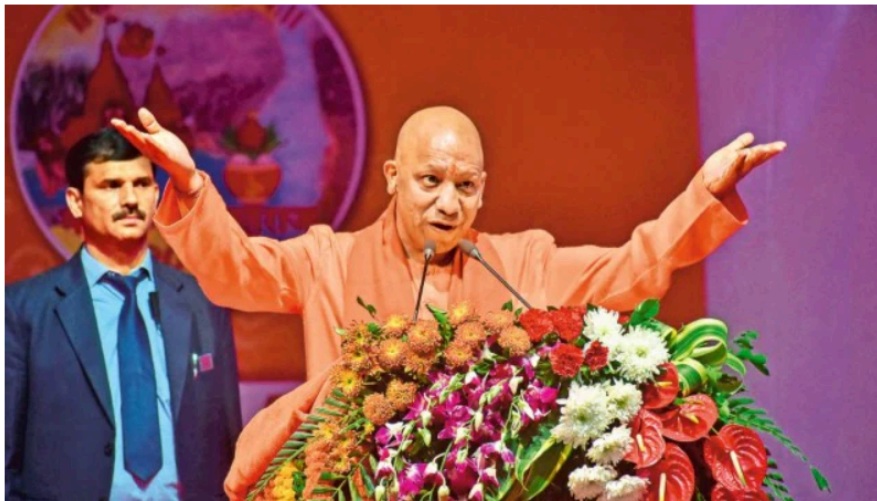
Vice-President Jagdeep Dhankhar, Governor Anandiben Patel and Chief Minister Yogi Adityanath will